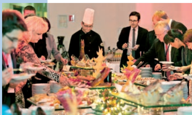
Wigilia polskich regionów w Komitecie Regionów w Brukseli