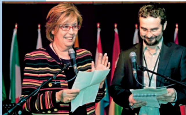
Oficjalne otwarcie Wigilii polskich regionów, Mercedes Bresso, Przewodnicząca Komitetu Regionów w Brukseli

rzywami, kulebiak z pstrągiem czy sałatka ze śledziem. Goście raczyli się także gorącymi daniami serwowanymi przez kucharzy m.in.: sandaczem na grzybowej kapuście, świąteczną kaczką w ciepłej żurawinie z pierożkami kurkowymi. Nie zabrakło też wigilijnej kutii i makowego zawijańca z lukrem. Świąteczny nastrój wprowadziła Aleksandra Kwaśniewska