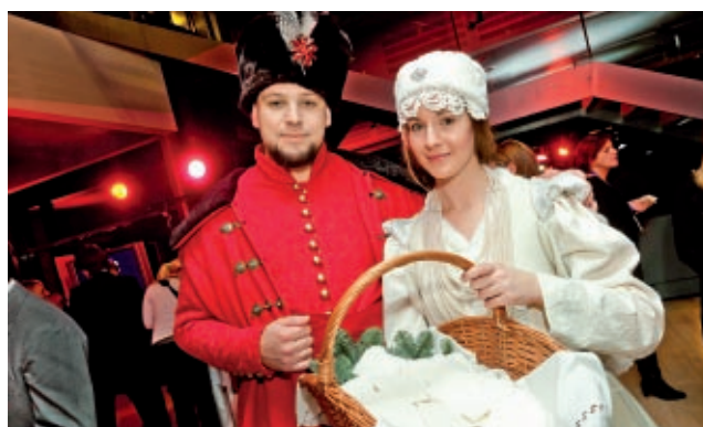
Wigilia polskich regionów w Komitecie Regionów w Brukseli