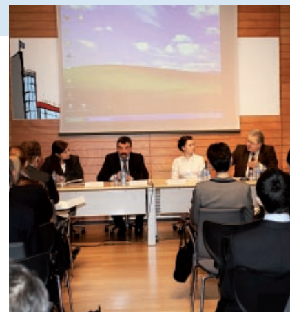
Czesław Siekierski, Poseł do Parlamentu Europejskiego

Następnie uczestnikom zaprezentowano działania Samorządu Województwa Śląskiego na rzecz zrównoważonego rozwoju obszarów wiejskich na przykładzie Programu Owca Plus, działalności spółdzielni Gazdowie, Stowarzyszenia Eurromontana oraz Forum Rozwoju Efektywnej Energii (Inicjatywa FREE). Polskie stanowisko na temat zrównoważonego rozwoju terenów wiejsko-górskich oraz systemów ochrony jakości żywności w Unii Europejskiej przedstawił Andrzej Babuchowski – Radca Minister, Koordynator Wydziału ds. Rolnictwa i Rybactwa, Stałe Przedstawicielstwo RP przy UE.