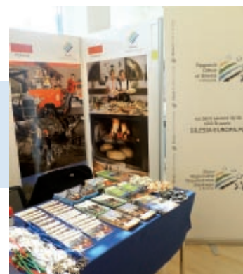
Stoisko Województwa Śląskiego w Komitecie Regionów

Instytucje Unii Europejskiej na co dzień są pilnie strzeżone i niedostępne dla zwiedzających. Wyjątek od tej reguły stanowi odbywające się raz do roku święto „Open Doors Day”, organizowane z okazji rocznicy podpisania Deklaracji Schumana (9 maja 1950). Tak stało się też w tym roku – w sobotę, 7 maja, Parlament Europejski, Komisja Europejska oraz Komitet Regionów otworzyły swoje drzwi dla wszystkich zainteresowanych.