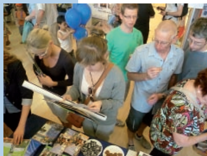
Open Doors w Komitecie Regionów

stawione zostało stoisko z materiałami informacyjno-promocyjnymi z Regionu. Goście byli częstowani również regionalnymi produktami gastronomicznymi. Stoisko Województwa Śląskiego cieszyło się dużym zainteresowaniem. Wiele osób chciało jak najwięcej dowiedzieć się o Regionie. Planując wakacje w Polsce, chcieli umieścić na swoich trasach zwiedzania atrakcje turystyczne z Regionu.