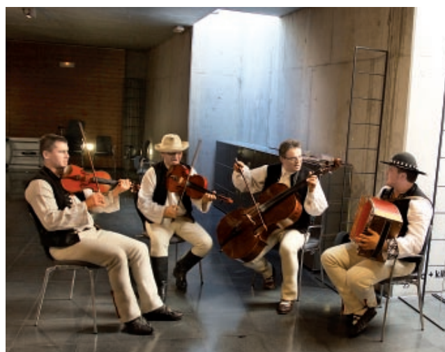
Część artystyczna seminarium