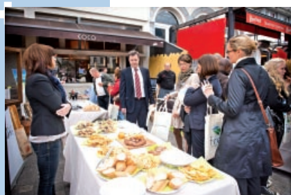
Bruksela: stoisko Biura Regionalnego Województwa Śląskiego na placu Luksemburskim

W trakcie konferencji, Biuro Regionalne Województwa Śląskiego w Brukseli, miało możliwość promowania regionu na specjalnie przygotowanym stoisku, na którym prezentowane były broszury na temat Województwa Śląskiego, w tym ochrony środowiska w regionie.