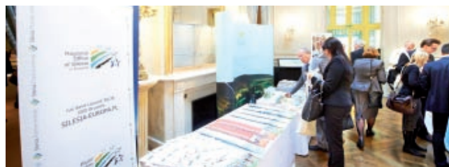
Stoisko Biura Regionalnego Województwa Śląskiego w Brukseli w Concert Noble