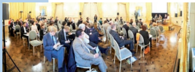
Konferencja „Raport na temat energii na obszarach wiejskich w Europie” w Concert Noble w Brukseli

decydentów politycznych. W konferencji wzięto udział ponad 100 osób w tym przedstawiciele Komisji Europejskiej, Parlamentu Europejskiego, Komitetu Regionów i Europejskiego Komitetu Ekono-